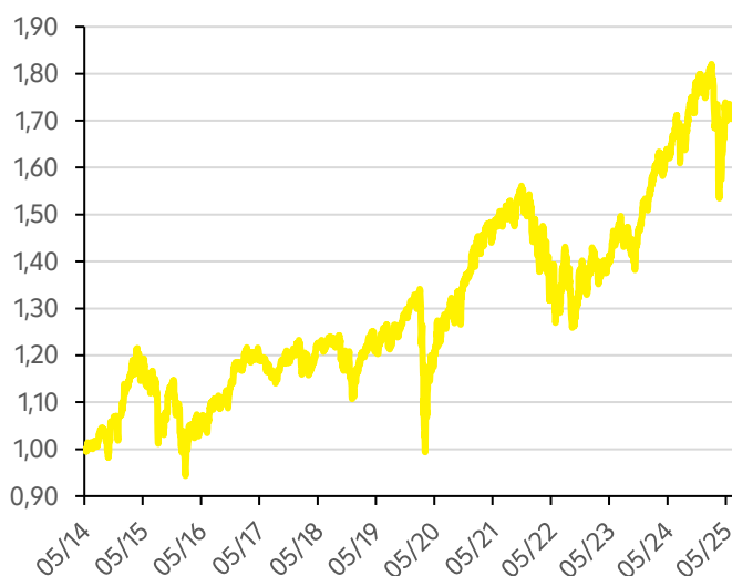
Vývoj hodnoty fondu Strategy 75